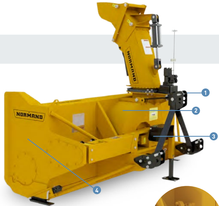
Chaîne dans un bain d'huile en HARDOX 450